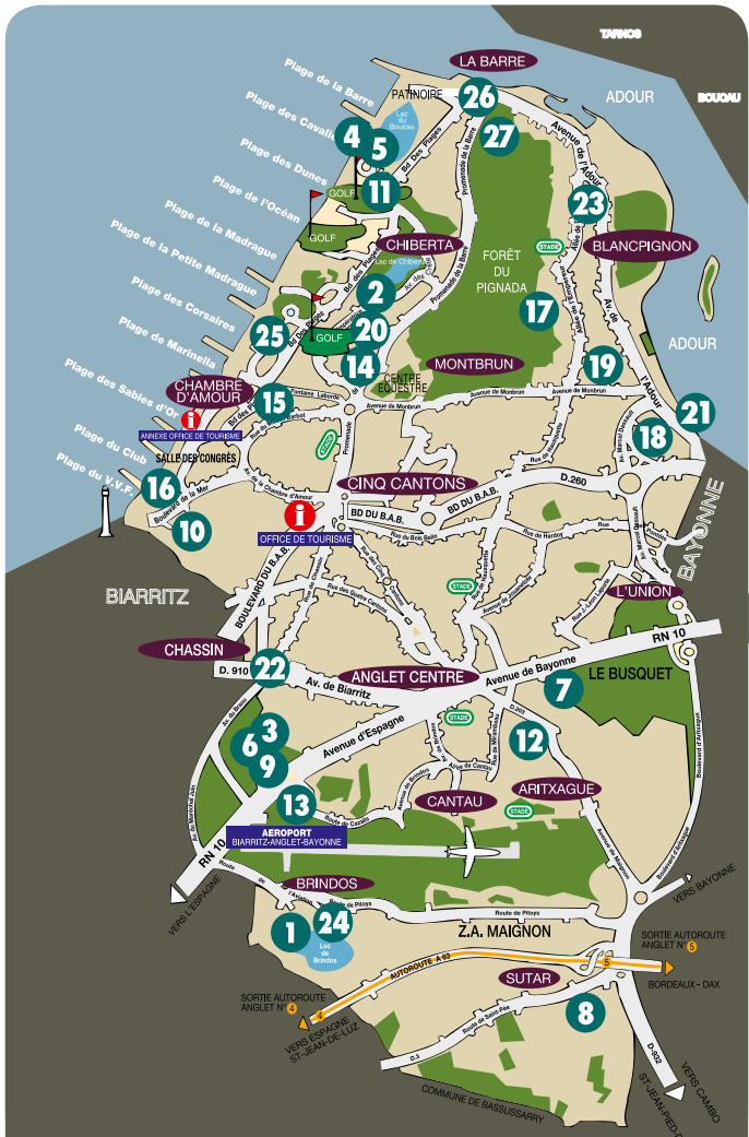
Plan d'Anglet map / mapa