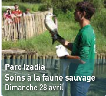
Parc Izadia Soins à la faune sauvage Dimanche 28 avril