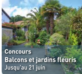
Concours Balcons et jardins fleuris Jusqu'au 21 juin