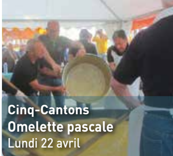
Cinq-Cantons Omelette pascale Lundi 22 avril