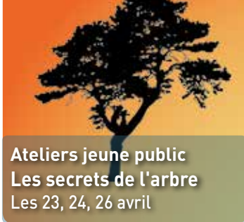
Ateliers jeune public Les secrets de l'arbre Les 23, 24, 26 avril